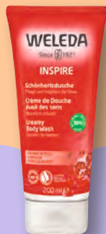
Weleda Inspire Schönheitsdusche Granatapfel Pflegt und inspiriert die Sinne