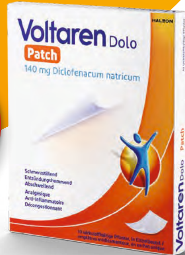
Voltaren Dolo Patch

* bei akuten Arthrose-, Rückenschmerzen sowie Sport- und Unfallverletzungen