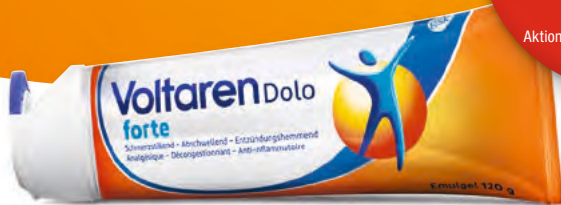
Voltaren Dolo forte Emulgel

20% Rabatt auf Voltaren Dolo forte Emulgel, Dolo Patch, Dolo forte Liquid Caps und Dragees Aktionsdauer 26.04. bis 25.05.2024 gültig solange Vorrat