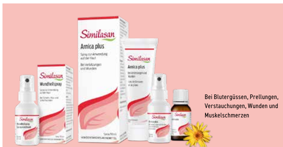
Bei Blutergüssen, Prellungen, Verstauchungen, Wunden und Muskelschmerzen

Diese vier Wirkstoffe beispielsweise unterstützen sich sinnvoll in ihrer Wirkung und können mithelfen, dass auch der Nachwuchs nach kleineren Blessuren im Nu wieder Vollgas geben kann.